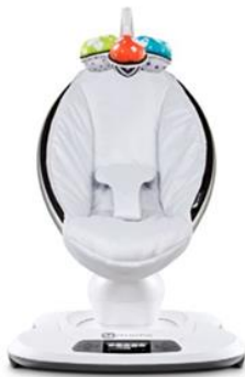
mamaRoo Model 1026