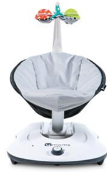
rockaRoo Model 4M-012