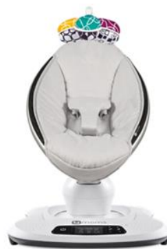
mamaRoo Model 1037