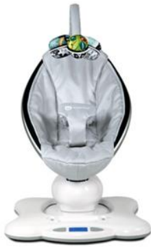
mamaRoo Model 4M-005