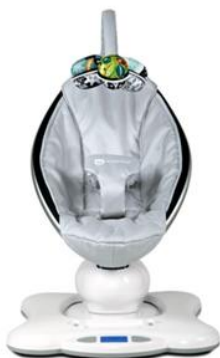
mamaRoo Model 4M-005

MamaRoo Gugalnik (modeli 4M-005, 1026 in 1037) in RockaRoo gugalnik (številka modela 4M-012) sta upravičena do brezplačne nadgradnje (poenostavljeno: vsi gugalniki mamaRoo in rockaRoo). Otroška posteljica 4moms sleep ni vključena v nadgradnjo.