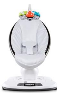
mamaRoo Model 1026