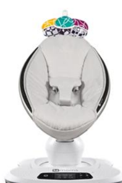
mamaRoo Model 1037